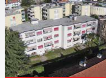
Lamone , via Carsiné 5