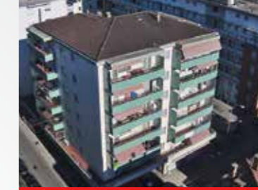
Lugano , via Fusoni 5