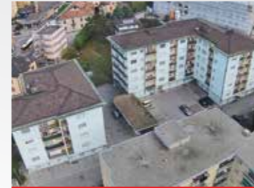
Bellinzona , via S. Gottardo 58 ABC