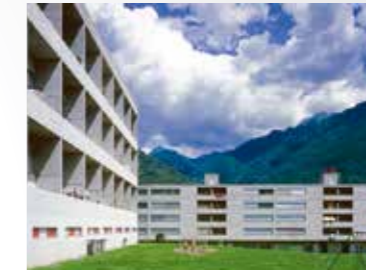
Monte Carasso , via Mundàsc 2