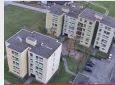
Biasca , via Quinta 53