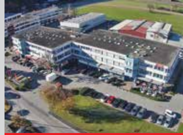
Quartino , via Luserte 2-4