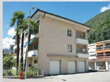
Locarno , via in Selva 17