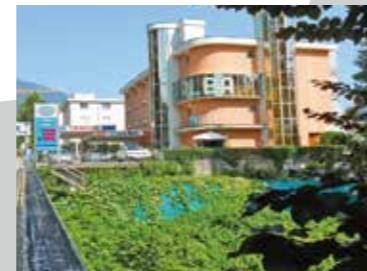
Minusio , via Simen 58