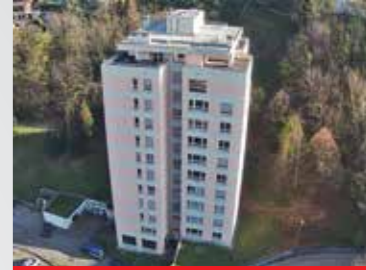
Lugano , via dei Faggi 23