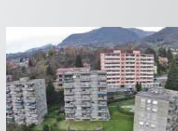
Vacallo , via Bellinzona 10-11