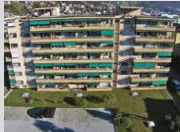
Locarno , via Rovedo 15 via Romerio 12