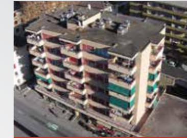
Lugano , via Bagutti 26