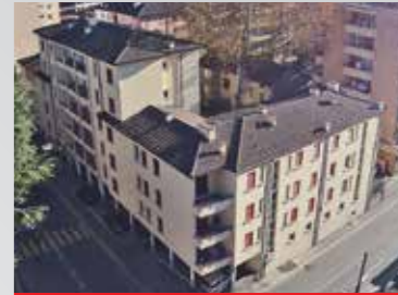
Lugano , via Beltramina 6-8-10