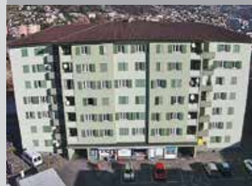
Locarno , via Nessi 38