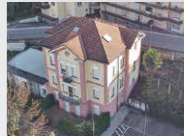
Paradiso , via Carona 6