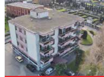
Bellinzona , via Ghiringhelli 18