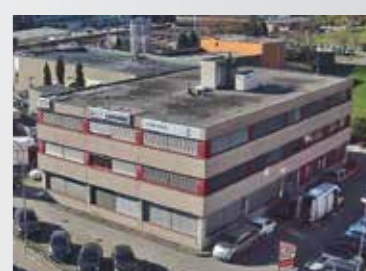
Manno , via Cantonale 27