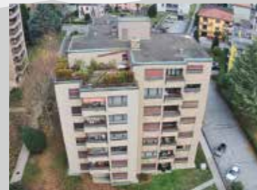
Giubiasco , vie Olgiati / Lugano